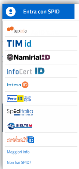
Figura 3 – elenco dei gestori d'identità accreditati dall'AgID

Occorrerà quindi selezionare il gestore con il quale si è effettuata la registrazione per il rilascio delle credenziali. (vedi paragrafo COME OTTENERE LE CREDENZIALI )