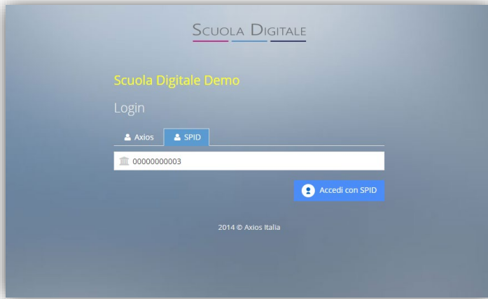
Figura 1 - Login di Axios Scuola Digitale con doppia opzione di accesso.

Una volta ottenuto lo SPID sarà sufficiente andare su https://scuoladigitale.axioscloud.it/ e scegliere di effettuare il login con SPID.